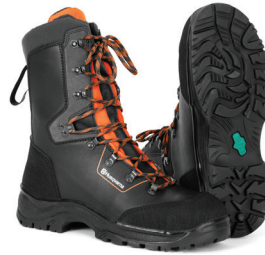
HUSQVARNA BOTTES CLASSIC TAILLE 39 597 65 94-39