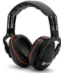
HUSQVARNA PROTECTEURS D'OREILLES AVEC SERRE-TÊTE RÉGLABLE 505 66 53-04