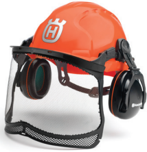
HUSQVARNA CASQUE CLASSIC 580 75 43-01