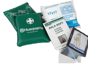
HUSQVARNA KIT PREMIER SECOURS 504 09 53-01