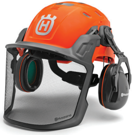
HUSQVARNA CASQUE TECHNICAL 585 05 84-01