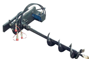
Tarière · KA2649