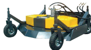
Tondeuse à gazon · KA2657