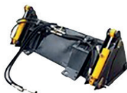
Godet basculant 4 en 1 · KA2659