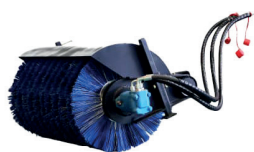
Balayeuse biseautée · KA2648