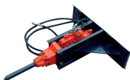
Marteau-piqueur hydraulique · KA2658